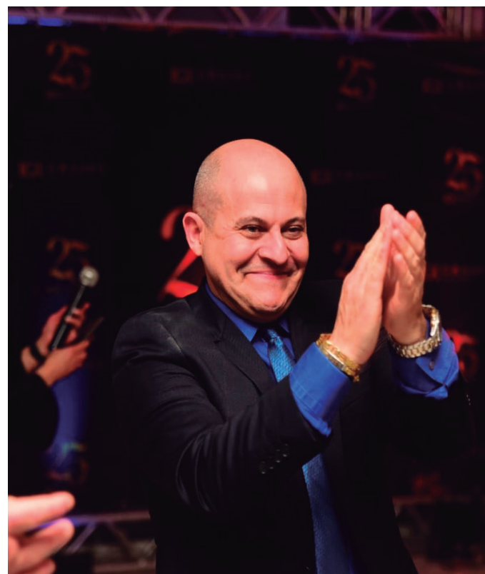
IGR GRASEL Advogados

Finalmente estamos na semana do grande evento, de luxo e glamour: O Prêmio Personalidades do Ano 2024, reunindo os destaques empresariais profissionais que fizeram a diferença no ano. O evento acontece neste sábado, dia 25 de janeiro, no Salão Porto Belo, Mercure Hotel em Balneário Camboriú, sob o comando deste colunista e do Portal e TV Lithoral News.