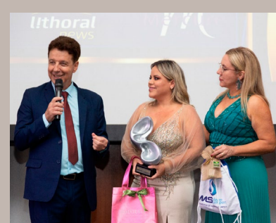
Viviane Alves – Programa Fama e Destaque – Rede TV