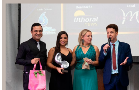
Família Caetano - Duo Violino e Voz