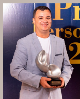
Jair Moreno – Psicanalista – Escritor – Palestrante