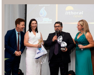
Henrique Ernani Teles – Jornal Diário DC